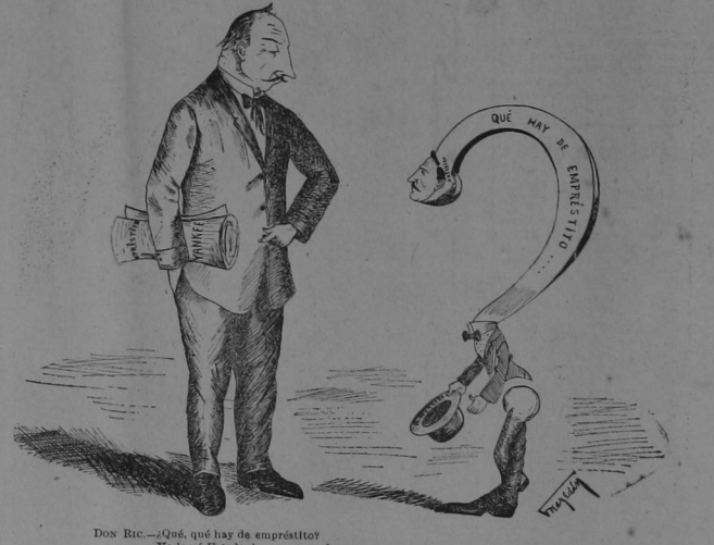
Don Ric.—¿Qué, qué hay de empréstito? Ya lo vé Usted: el uno enterrado y por el otro... están doblando!